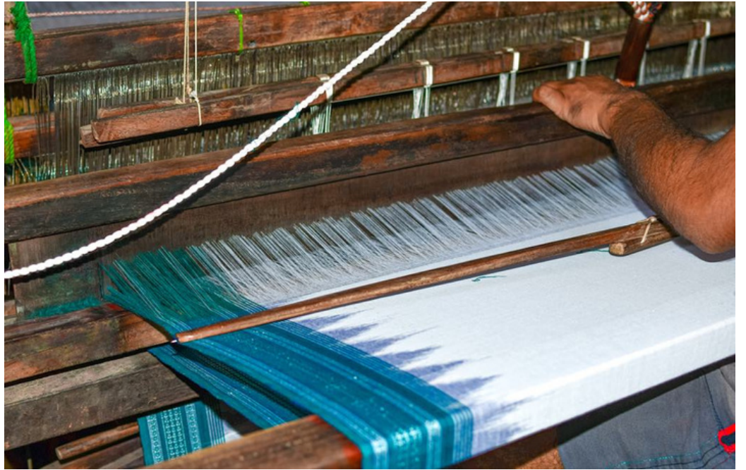
Sambalpuri weave

शुरुआती सर्दी काश उसे सुन पाता दिव्यंगत बेटा