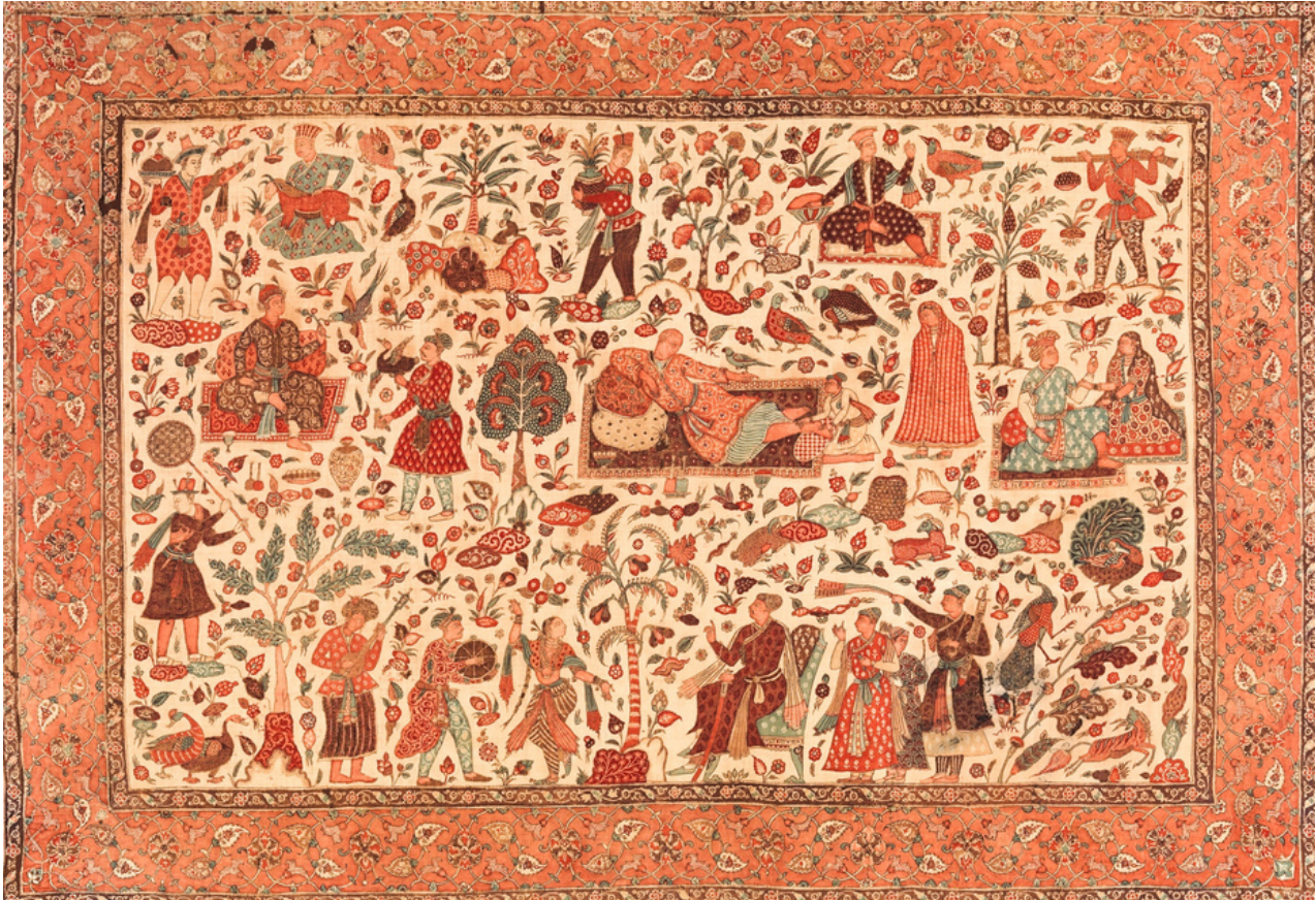
Carpet weaving