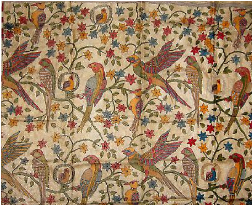
Kantha Embroidery