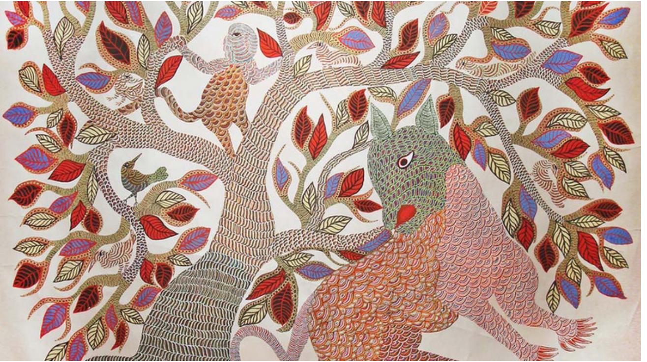
Gond Art