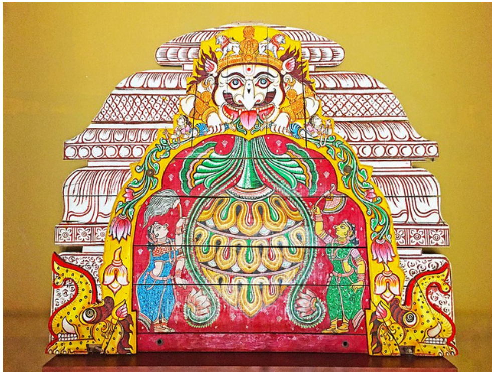
Pattachitra from Orissa